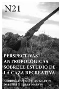
Núm. 21 (2021) diciembre 30, 2021