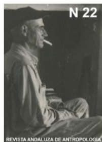
Núm. 22 (2022) junio 30, 2022