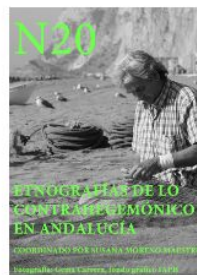
Núm. 20 (2021) julio 29, 2021